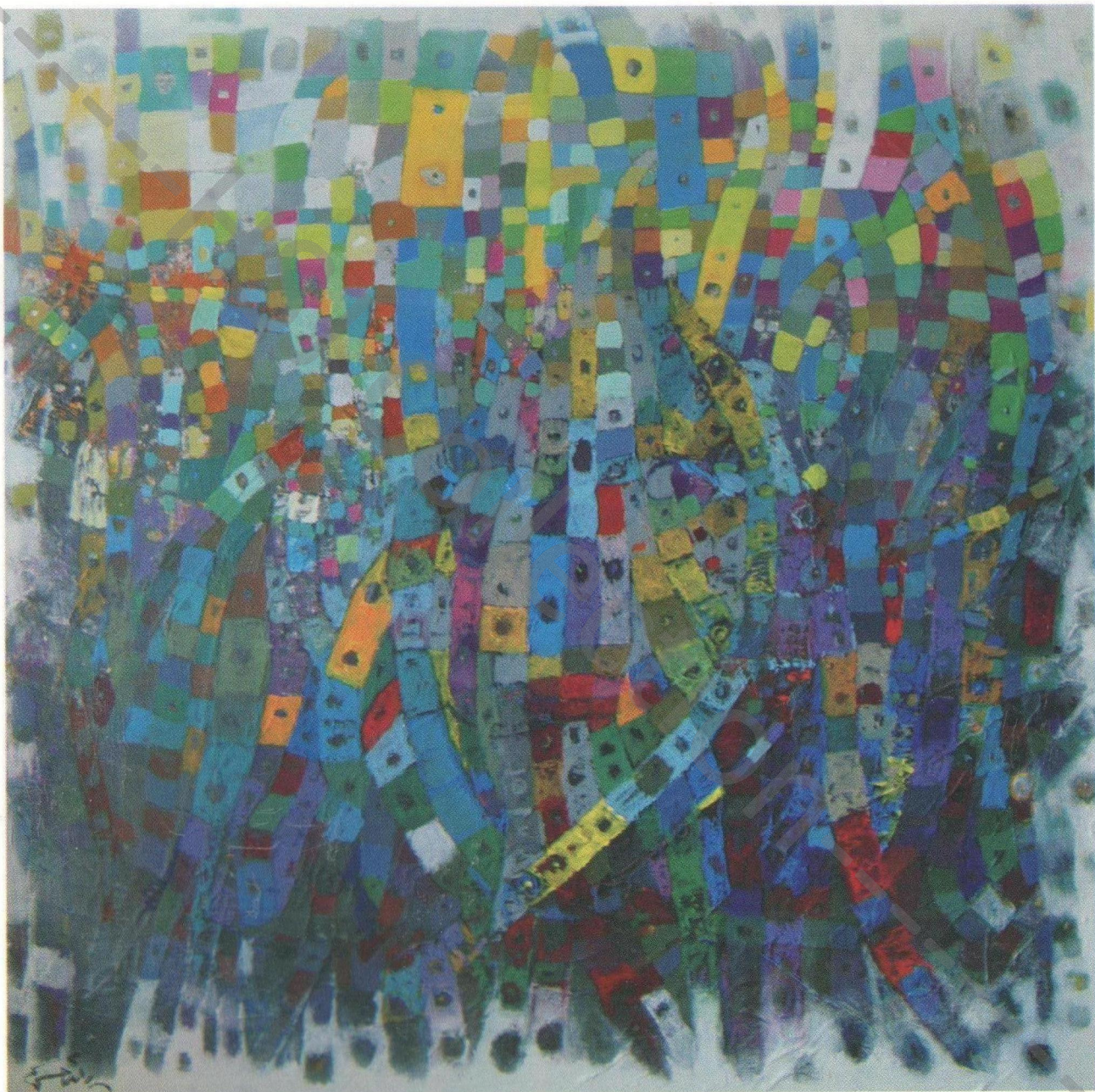
Acrylic on canvas 80 x 80 cm