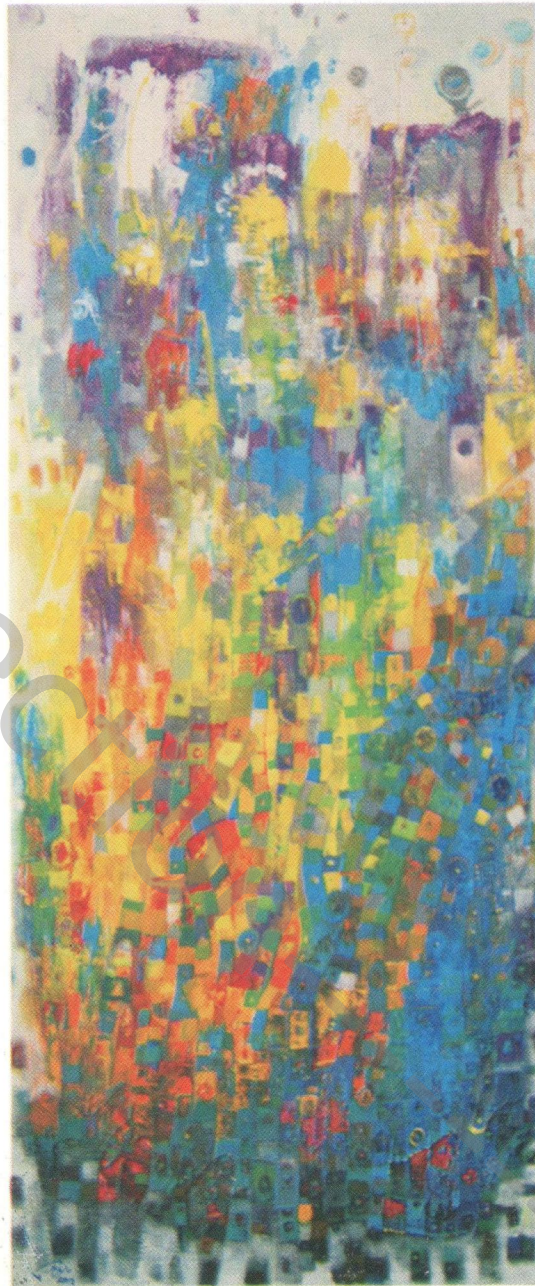
Acrylic on canvas 70 x 150 cm