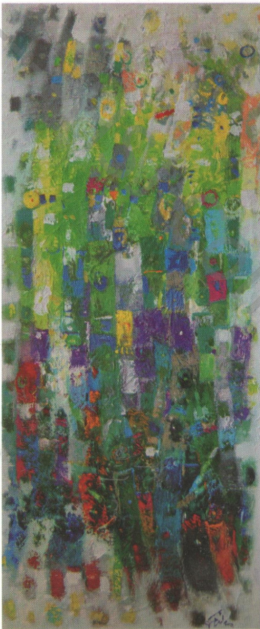
Acrylic on canvas 30 x 70 cm