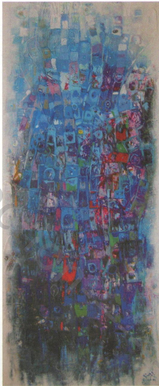
Acrylic on canvas 50 x 100 cm