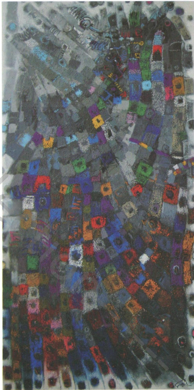
Acrylic on canvas 50 x 100 cm