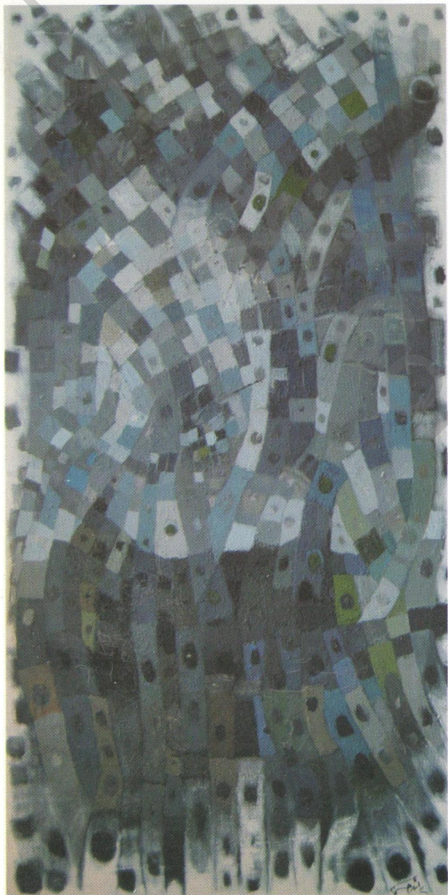
Acrylic on canvas 50 x 100 cm