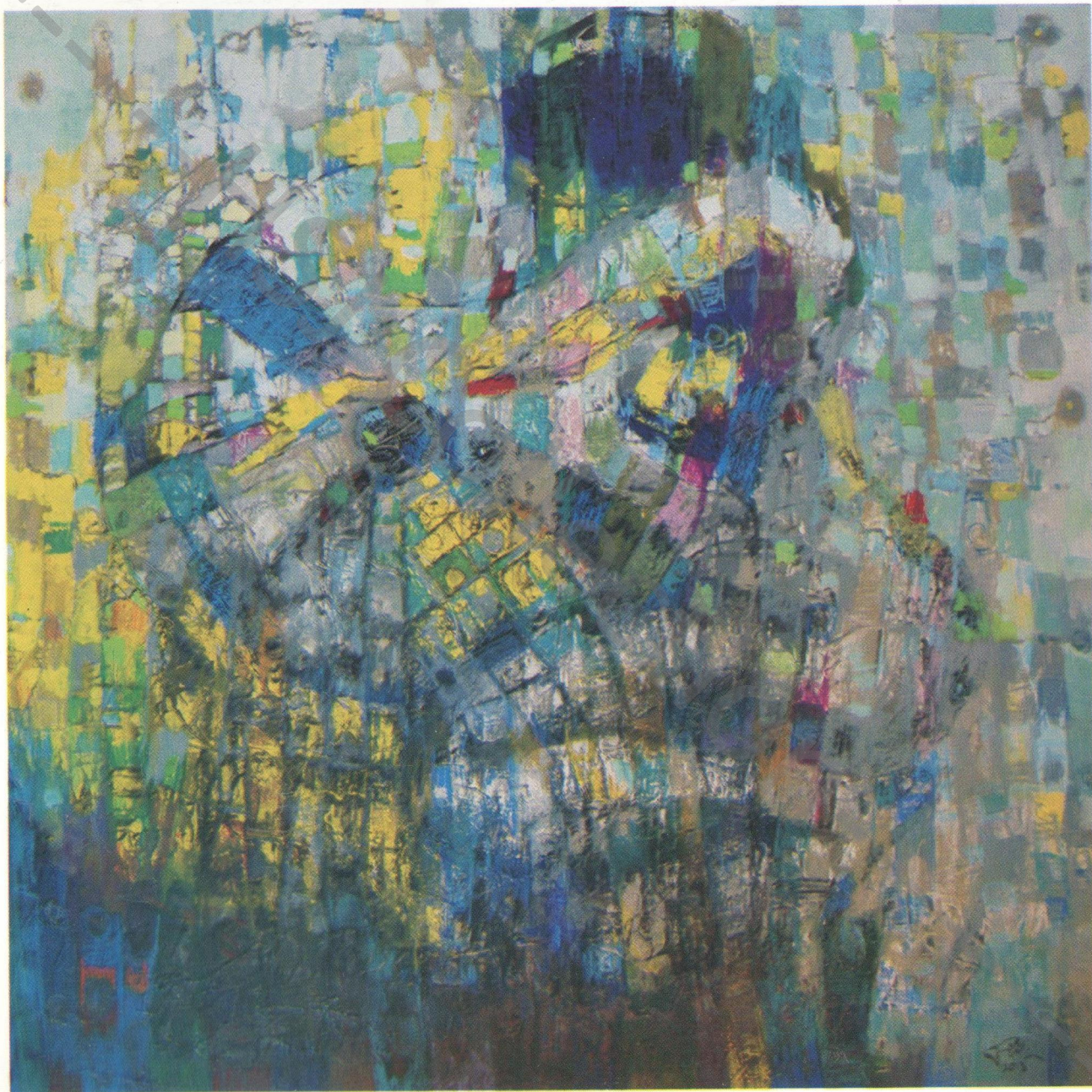
Acrylic on canvas 100 x 100 cm