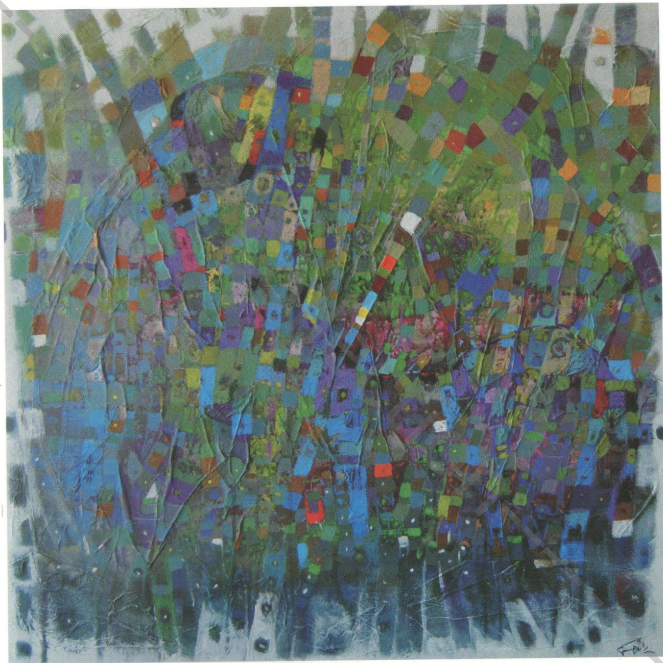
Acrylic on canvas 80 x 80 cm