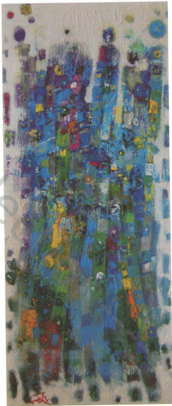
Acrylic on canvas 30 x 70 cm