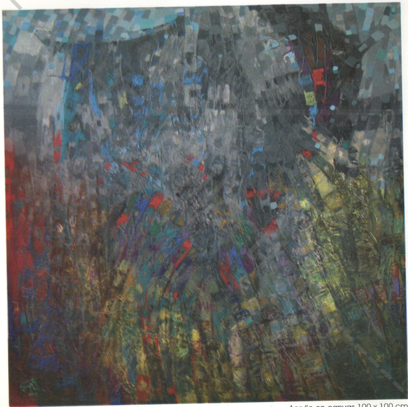
Acrylic on canvas 100 x 100 cm