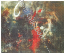
83x95 cm. Oil on canvas 1977