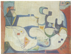
94x82 cm, Oil on canvas 1961