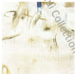
128 X 128 Cm Mixed Media On Wood 1991