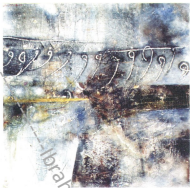
100a 130 Cm Mixed Media On Canvas 1969