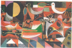
84x78 cm. Oil on wood 1953