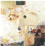
120 X 120 Cm Mixed Media On wood 1999