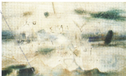
185x106 cm. Mixed media on wood 1976