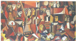
150x17 cm, Oil on wood 1993