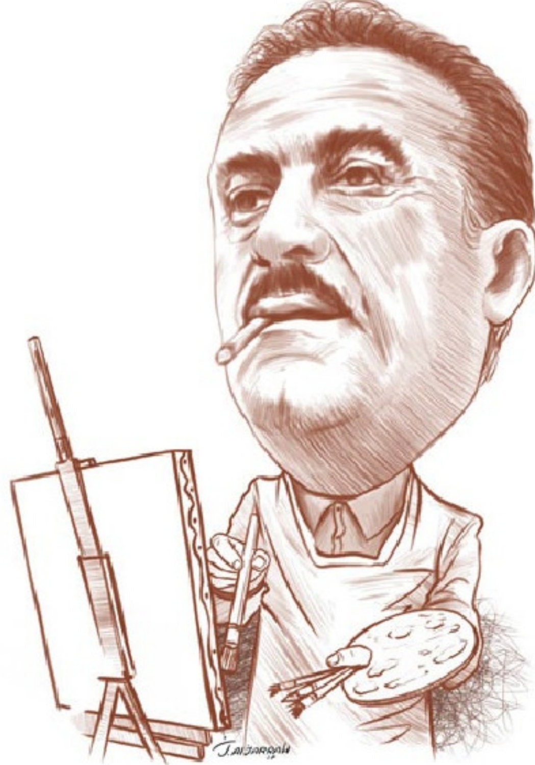
عراقي وحيد في فنه وحيد في حياته

لندن - كانت هناك في العراق جماعة فنية أسماها "الانطباعيون" تزعمها الفنان الرائد حافظ الدروبي لم يكن أحد من أعضائها انطباعيا. لكن حتى الرسام العراقي الانطباعي الوحيد لم يكن عضوا في تلك الجماعة.